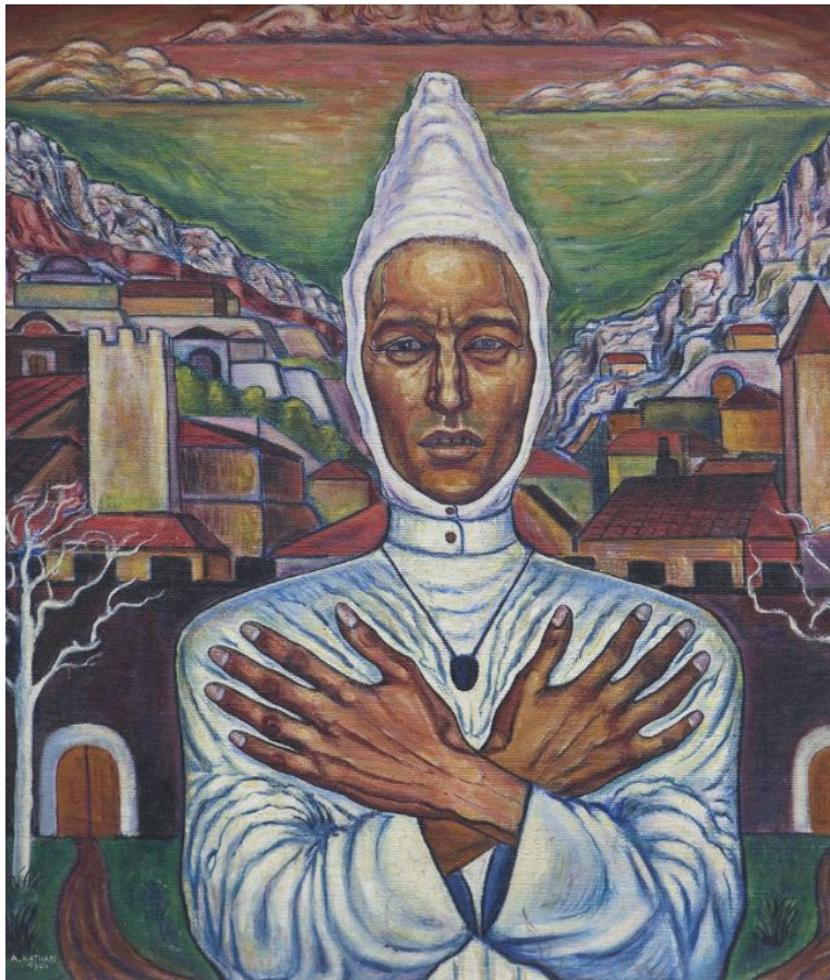
Incantatore (l'Asceta), 1924

Nelle sale di Torbandena Projects, al terzo piano di via S. Nicolò 11, si potrà visitare la rassegna con i seguenti orari: