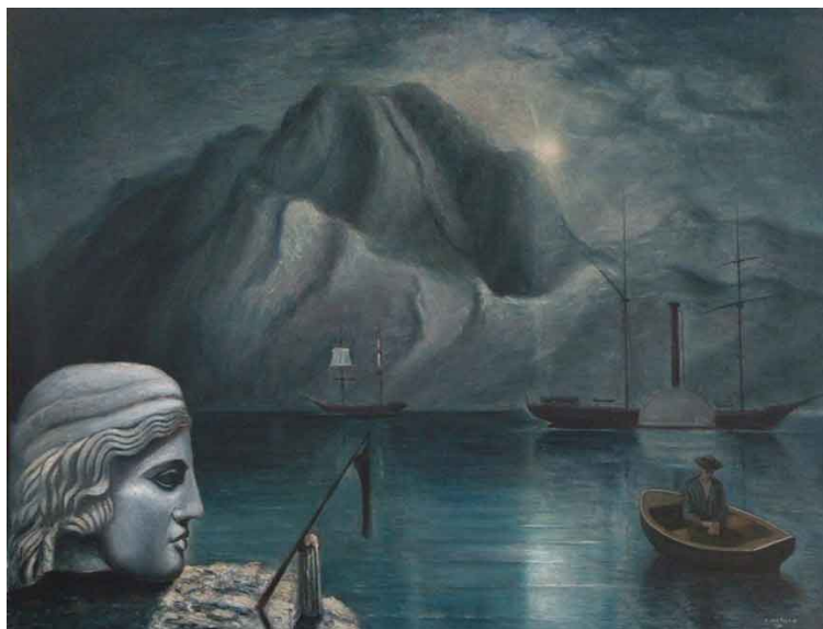
Sortilegi lunari, 1933