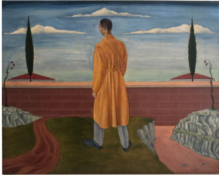
Pomeriggio d'autunno, 1925

Per la mostra di Trieste arriveranno opere di Arturo Nathan da collezioni prestigiose e si potranno rivedere nella nostra città, dopo molti anni, Fiume tropicale del 1921, L'Esiliato del 1928 (dalla collezione Barilla), L'abbandonata del 1930 (dalla collezione Lanfranchi), Costa ghiacciata con rovine del 1929, oltre a un importante raccolta di disegni e pastelli su carta.