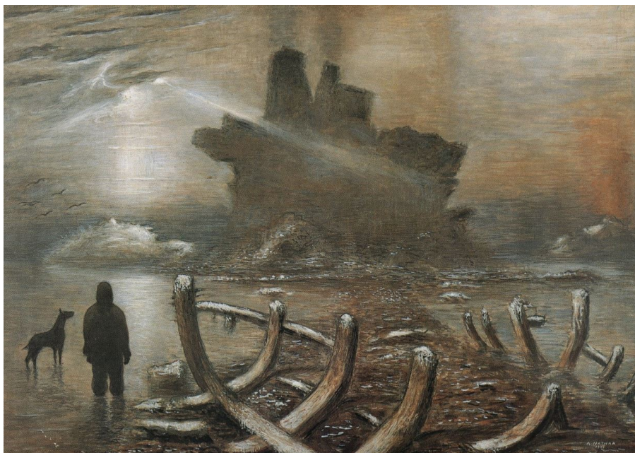
Rupi vulcaniche, 1933

In anni recenti sono molti i musei che hanno voluto ospitare opere di Nathan per alcune grandi mostre: L'Esiliato è stato esposto al MART di Rovereto, al Folkwang Museum di Essen e all'Ateneum Art Museum di Helsinki per la rassegna sul "Realismo magico". Palude del 1937 è stato presentato al MAR di Ravenna per "La seduzione dell'antico" e Sortilegi lunari del 1933 a Palazzo Madama di Torino nella rassegna "Dalla Terra alla Luna".