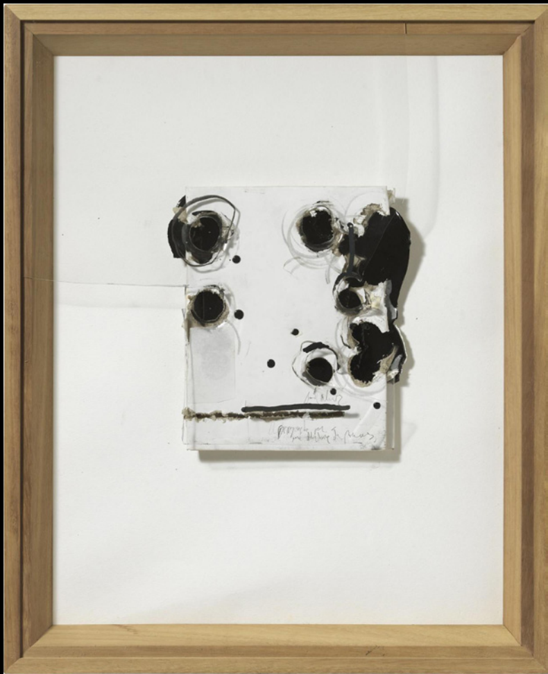
Projecte per a un llibre de poemes cm 75,5 x 61,5